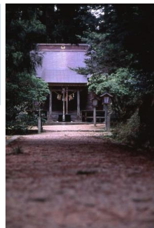
▲黄金山神社（宮城県涌谷町）