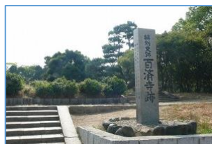
▲百済寺跡（大阪府枚方市）

困難な時代も懸命に生き抜いてきた人々を、時空を超えて見守ってきた中秋の名月を見ながら、今日あることへの感謝と喜びを噛み締めましょう。